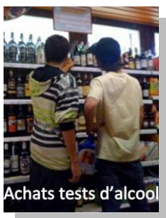
Achats tests d'alcool